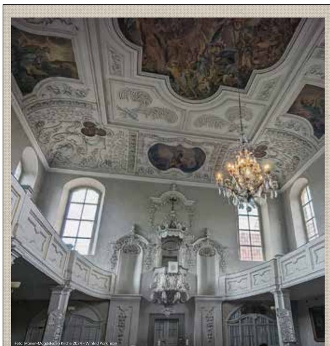
Foto: Marien-Magdalenen Kirche 2024