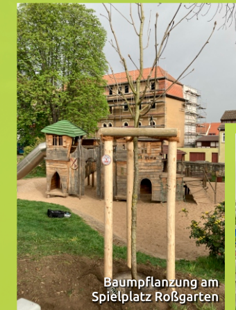
Baumpflanzung am Spielplatz Roßgarten