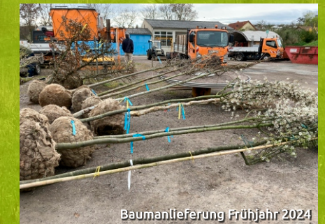
Baumanlieferung Frühjahr 2024