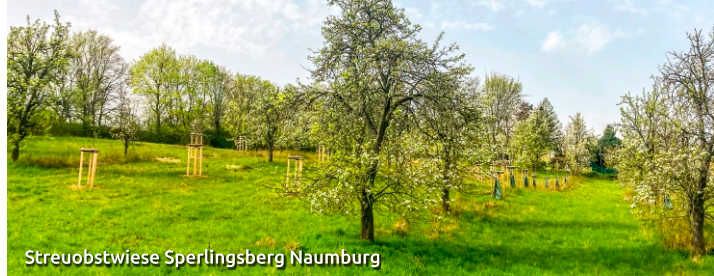
Streuobstwiese Sperlingsberg Naumburg

Schenken Sie Naumburg einen Zukunftsbaum!