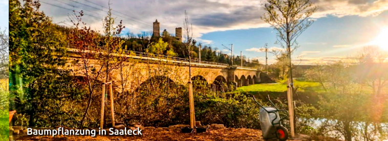
Baumpflanzung in Saaleck