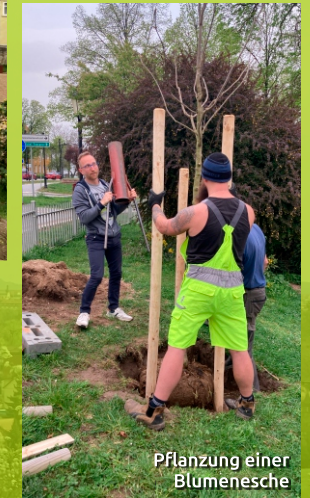
Pflanzung einer Blumenesche